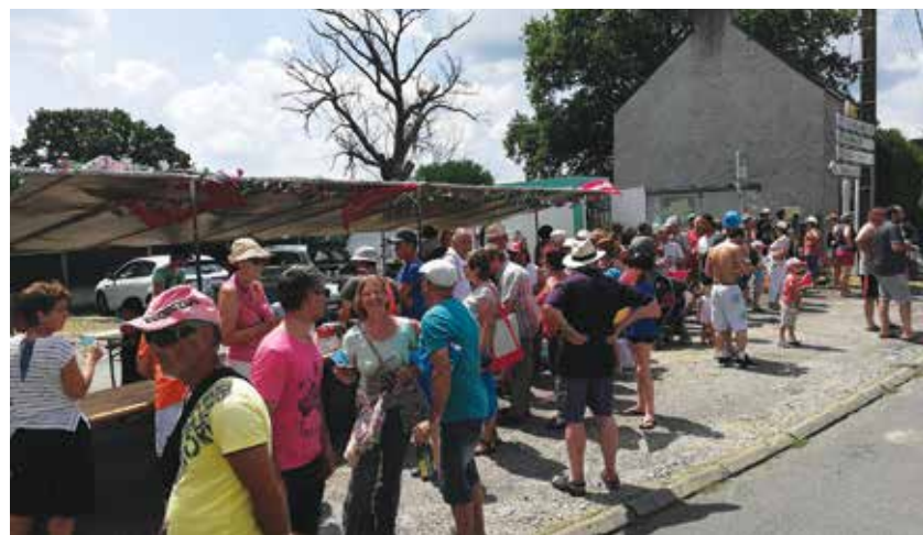
Buvette du Comité des Fêtes et vente de sandwiches par le conseil municipal dont les bénéfices ont été reversés aux 2 écoles de Quilly.