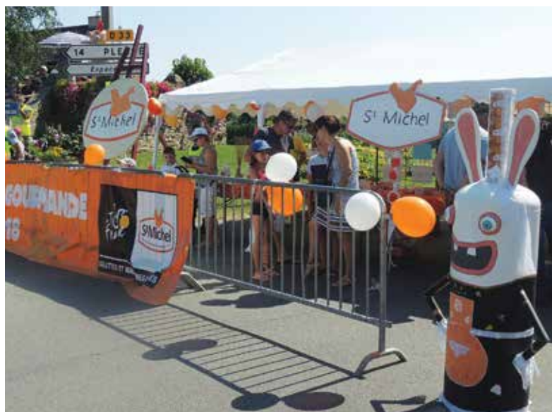
Stand Grand Prix des communes gourmandes réalisés par des élus