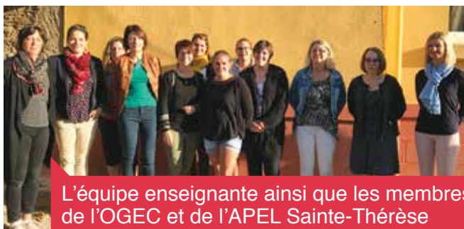
L'équipe enseignante ainsi que les membres de l'OGECE et de l'APEL Sainte-Thérèse

Tout au long de l'année, des projets autour du thème de la magie seront menés par les différentes classes. Les élèves, dans le cadre de la diffusion et de la pratique des arts, se rendront à plusieurs reprises au cinéma de Savenay. Un intervenant en musique prendra aussi en charge les deux classes de primaire pour animer des séances de chant-chorale. Les élèves, depuis la grande section jusqu'au CM2, iront à la piscine de Savenay à la fin du troisième trimestre. Des temps forts conviviaux, tels la soirée du goût, les portes ouvertes, le carnaval, les ateliers multi-âges, les célébrations ou bien la kermesse, vont ponctuer l'année scolaire.