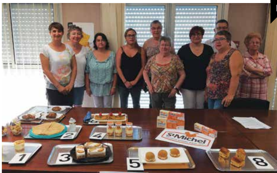
La présélection de la recette

Réalisation et installation des décorations par des bénévoles de la commune, des agents communaux et des élus.