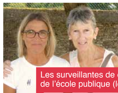
Les surveillantes de cour de l'école publique (le midi)