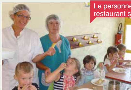
Le personnel du restaurant scolaire

Pour plus d'information, vous pouvez contacter le chef d'établissement, Nathalie Billy : 02 40 88 14 34 - ec.quilly.ste-therese@ec44.fr https://ecolestetheresequilly.fr/