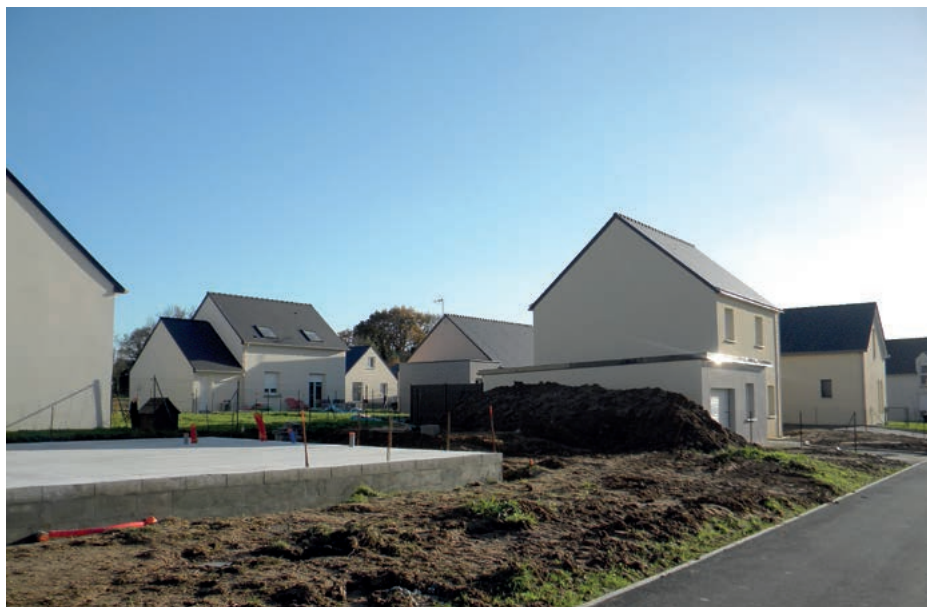
De nouvelles habitations sortent de terre à Bouée

A la suite des propositions faites aux élus pour mieux associer les habitants à cette révision, les 5 Conseils de Développement du pôle Métropolitain (Loire et Sillon, Erdre et Gesvres, Région de Blain, CARENE Saint-Nazaire agglomération et Nantes Métropole) ont produit ensemble un second avis sur « une nouvelle approche de l'habitat à l'échelle métropolitaine ».