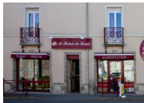
Relais de Bouée, commerce multiservices

Pour tout cela, il est nécessaire que les Elus de l'intercommunalité mettent en place un groupe de travail sur l'avenir du territoire et qu'ils associent la population à ces questions et réflexions.