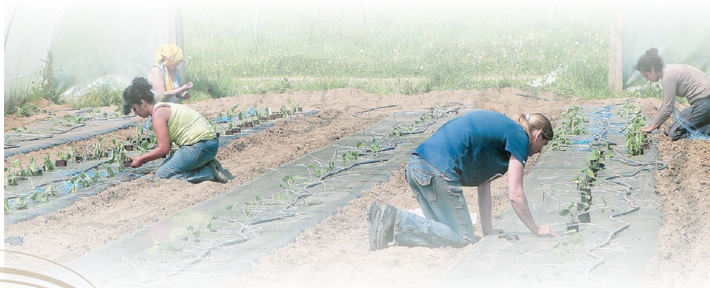
Tenue maraîchère Accès-Réagis