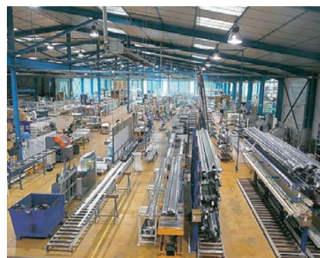
La société BUGAL à Malville

Un schéma d'accueil des entreprises a été réalisé à la demande de la communauté de communes. Il concerne l'économie productive. Cependant, il ne faut pas oublier d'avoir une réflexion complémentaire vers l'économie présentielle et l'économie sociale et solidaire, indissociables au maintien économique du territoire Loire et Sillon.