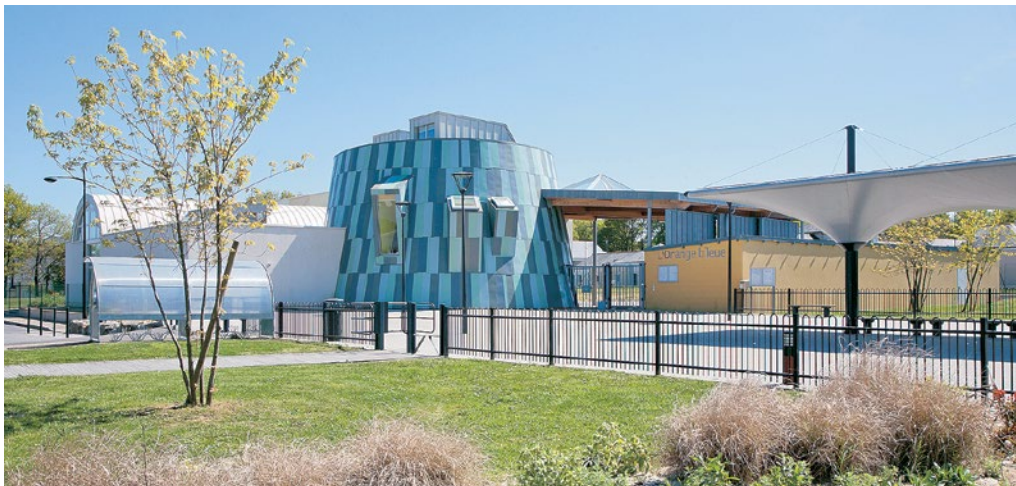
Groupe scolaire l'Orange Bleue à Malville